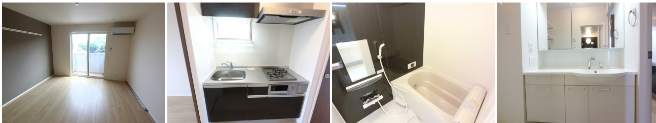
リビング 2口コンロ付きシステムキッチンです。 広めなユニットバスです。 三面鏡付きカウンター洗面化粧台

更新料1ヶ月、ルームクリーニング 料金42,900円、D-roomCard+料金16,500円、ICカード電池(初回)2,090円