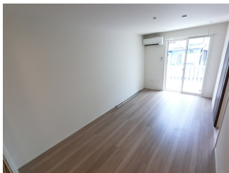
テレワークスペース